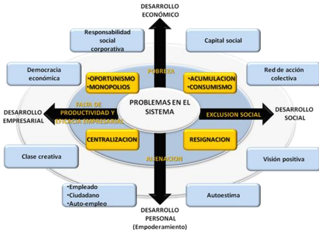
Figura 1. Problemas en el sistema del desarrollo nacional (Ibave, et al., 2011)

De esta forma, las demandas de innovación inherentes al desarrollo de nuevas actividades de negocios, mercados y de pertinencia social, serán holísticas, donde la integración y formación de equipos de alto desempeño multidisciplinarios representan la pauta para el alcance de los objetivos de otorgar valor a las ideas y que éstas, sean el detonante del cambio donde se balancean las funciones de plus valía y social, de acuerdo al modelo que se presenta a continuación (figura 1):